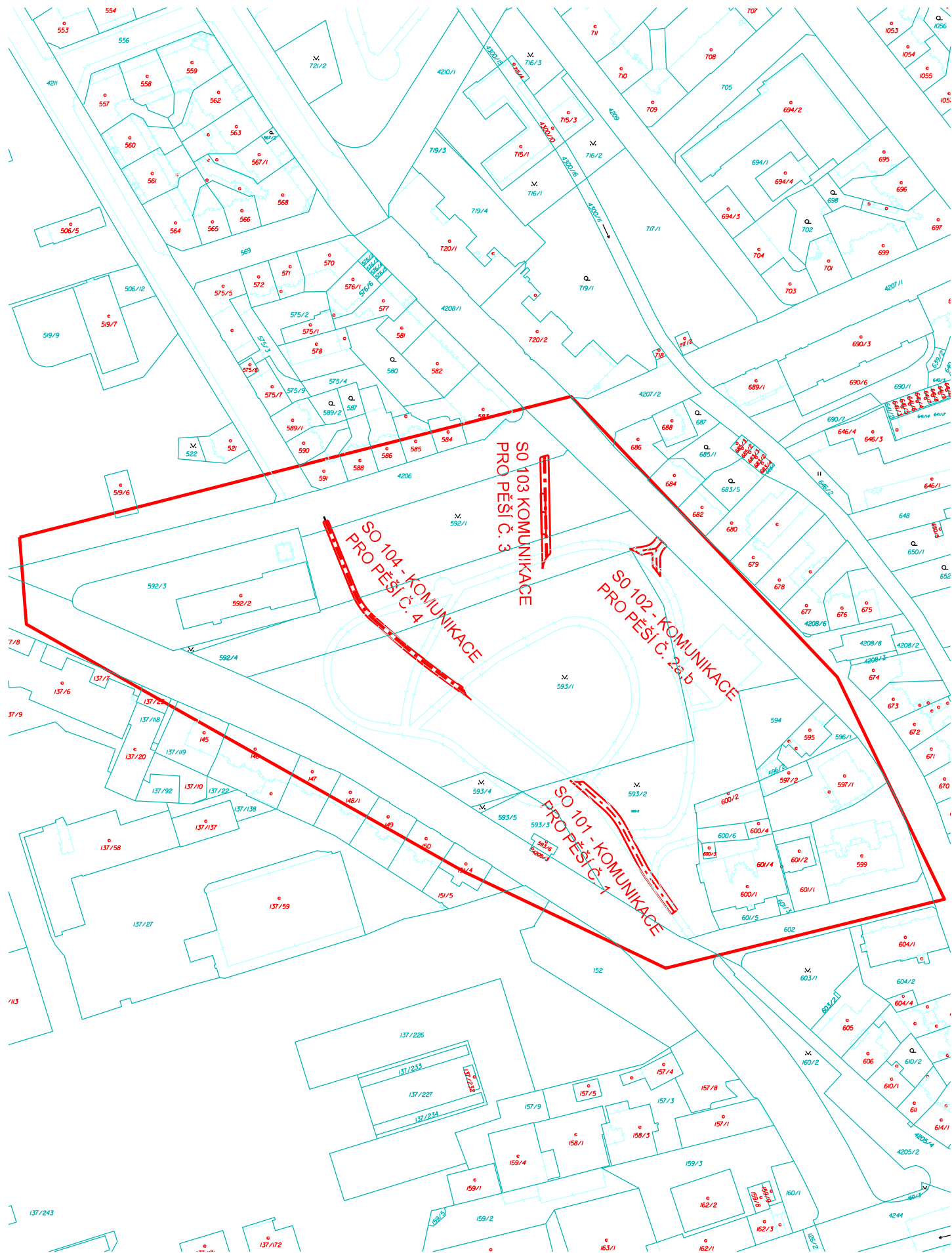
Katastrální území: Ústí nad Labem (774871) Dotčené parcely: 4206, 592/1, 593/1, 593/2